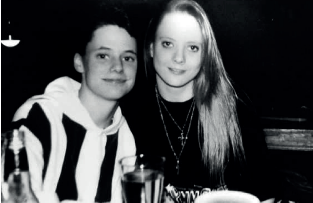
Brandon Teena et sa petite amie Lana Tisdel